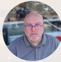
GINTARAS ŠEPUTIS režisierius