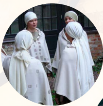
Sutartinių ansamblis „TRYS KETURIOSE“