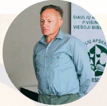
EUGENIJUS ŽMUIDA (lietuvių folkloro ir mitologijos tyrinėtojas, rašytojas)