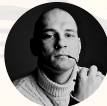
PETRAS LISAUŠKAS šokėjas, aktorius, choreografas