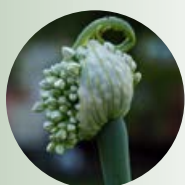
konkursas „Augalų portretai 2021“