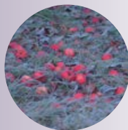
konkursas „Augalų portretai 2023“.