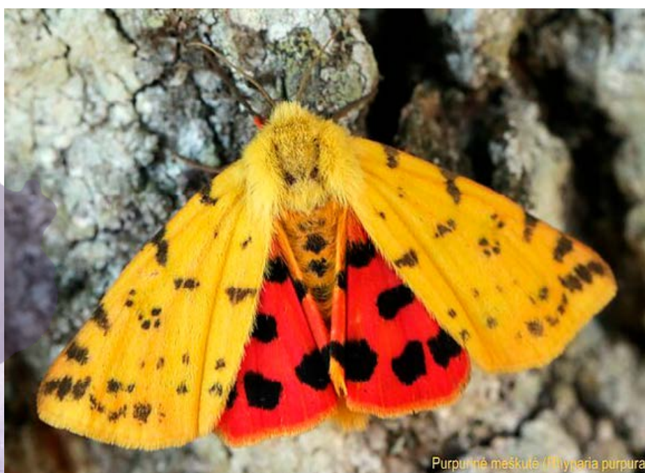
Purpurinė mėškutė ( Ulymyria purpura )

<Skaityti daugiau> Gamtos fotografė Ramunė Vakarė: gamtoje supratau, kad visi atsakymai slypi mumyse - LRT