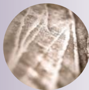
Manto Petravičiaus molio freska.